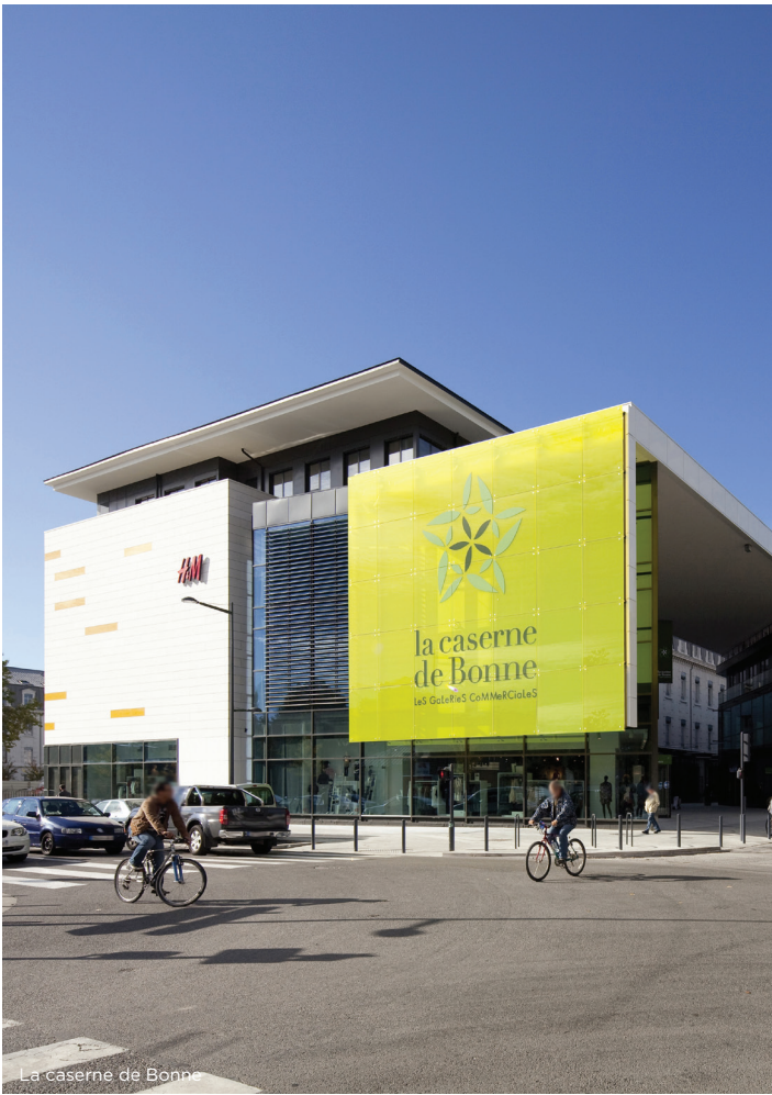
La caserne de Bonne