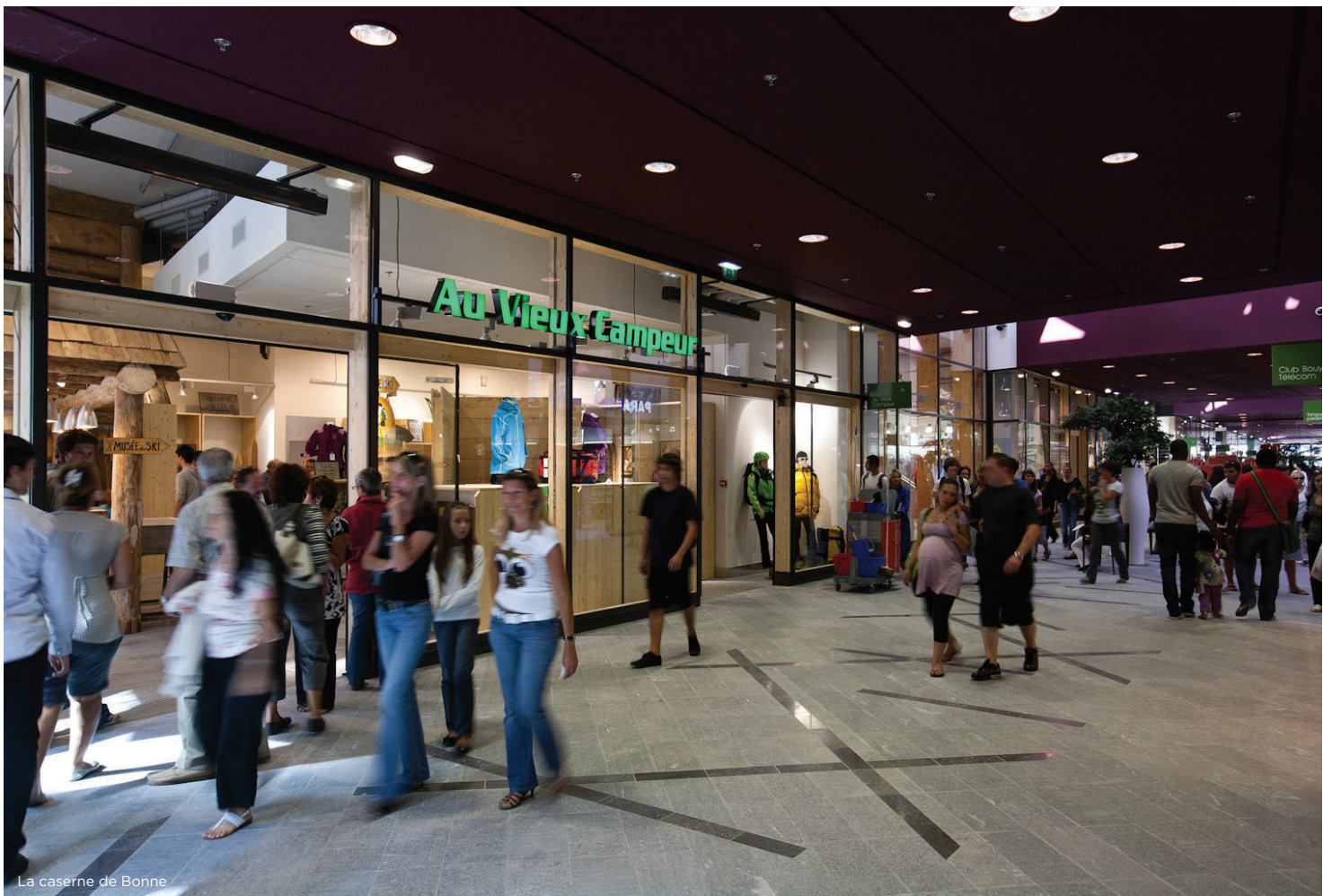
La caserne de Bonne