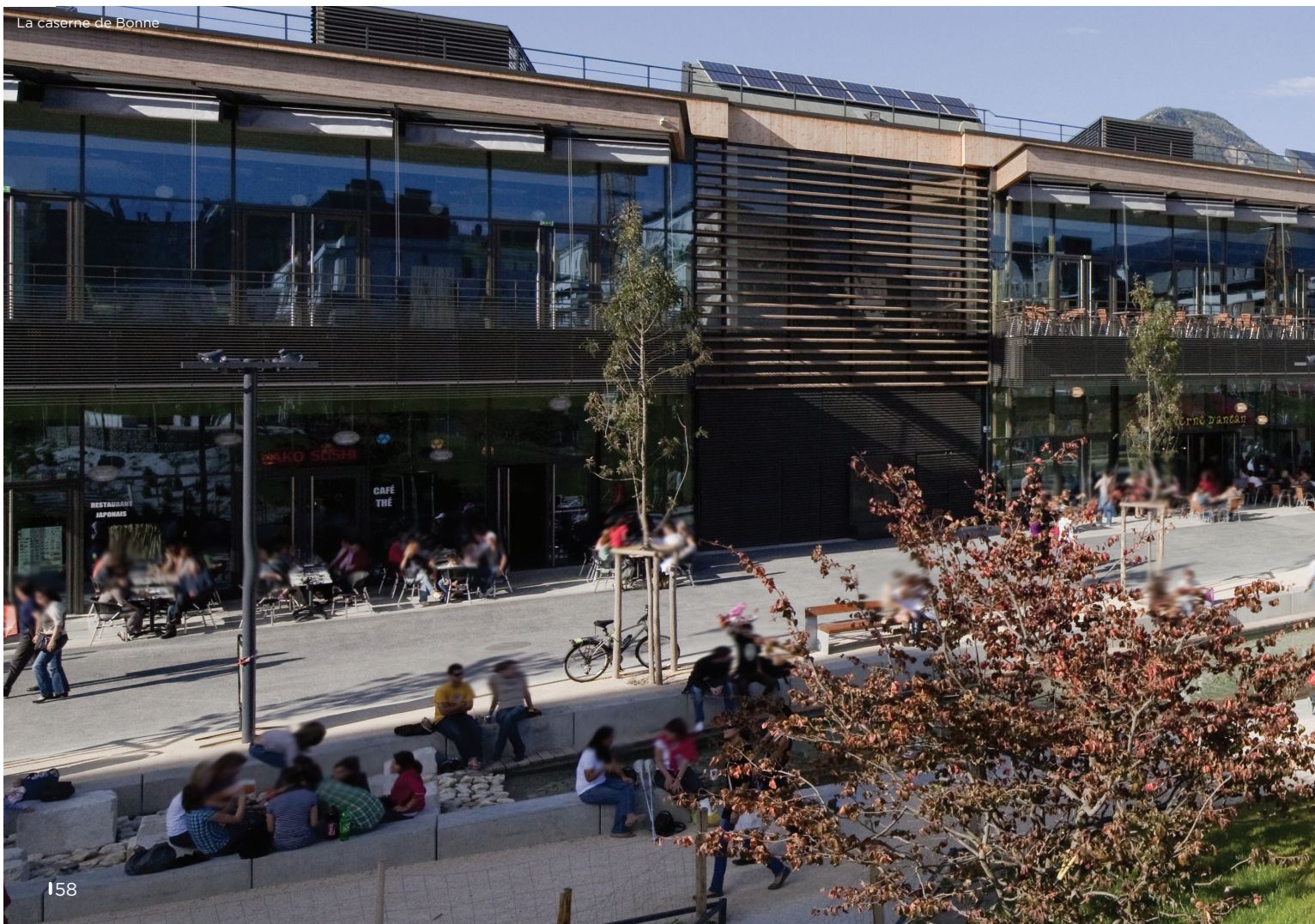
La caserne de Bonne