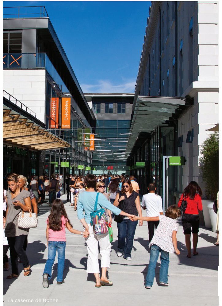
La caserne de Bonne